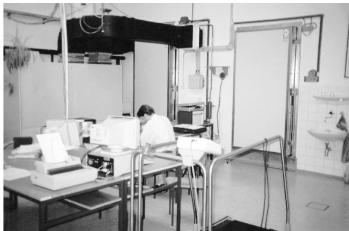
Sl. 1. Nadzorna miza in vhod v klimatsko komoro

Na podlagi predvidevanj, da spremenljivost mikroklimatskih ter svetlobnih delovnih razmer, upoštevajoč kakovost delovne predloge, pomembno vpliva na delovno uspešnost, smo se odločili izdelati teste, ki bi po svoji preprostosti in splošnosti izločili vpliv vsake predhodne vadbe in bi bili popolnoma neodvisni drug od drugega, kar pomeni da se določen problem vzdolž vseh besedil ne bi ponovil. Testi so bili sestavljeni iz preprostih računov, ki so vsebovali osnovno matematično opravilo seštevanja. Na vsakem listu je bilo 36 računov, in sicer takšnih, da je učenec moral sešteti številke in rezultat vpisati pod črto. Učenci so pred začetkom izvedbe meritev imeli 3 do 5 minut časa za prilagoditev danim razmeram dela. Samo testiranje pri posamezni kombinaciji delovnih razmer je trajalo 15 minut. Ker je bil čas reševanja omejen in ker je obstajala velika verjetnost, da bi kateri od učencev prehitro rešil vse izračune in ostal brez dela, smo pripravili še dodatna dva testna lista. Pri končni analizi so šteli izključno le pravilni in nepravilni odgovori. Števila in z njimi sestavljeni računi so bili izbrani po naključni izbiri z uporabo preglednic naključnih števil [21]. Po vsaki končani testni kombinaciji so učenci izpolnili tudi vprašalnik o subjektivnih občutkih med izvedbo meritev.